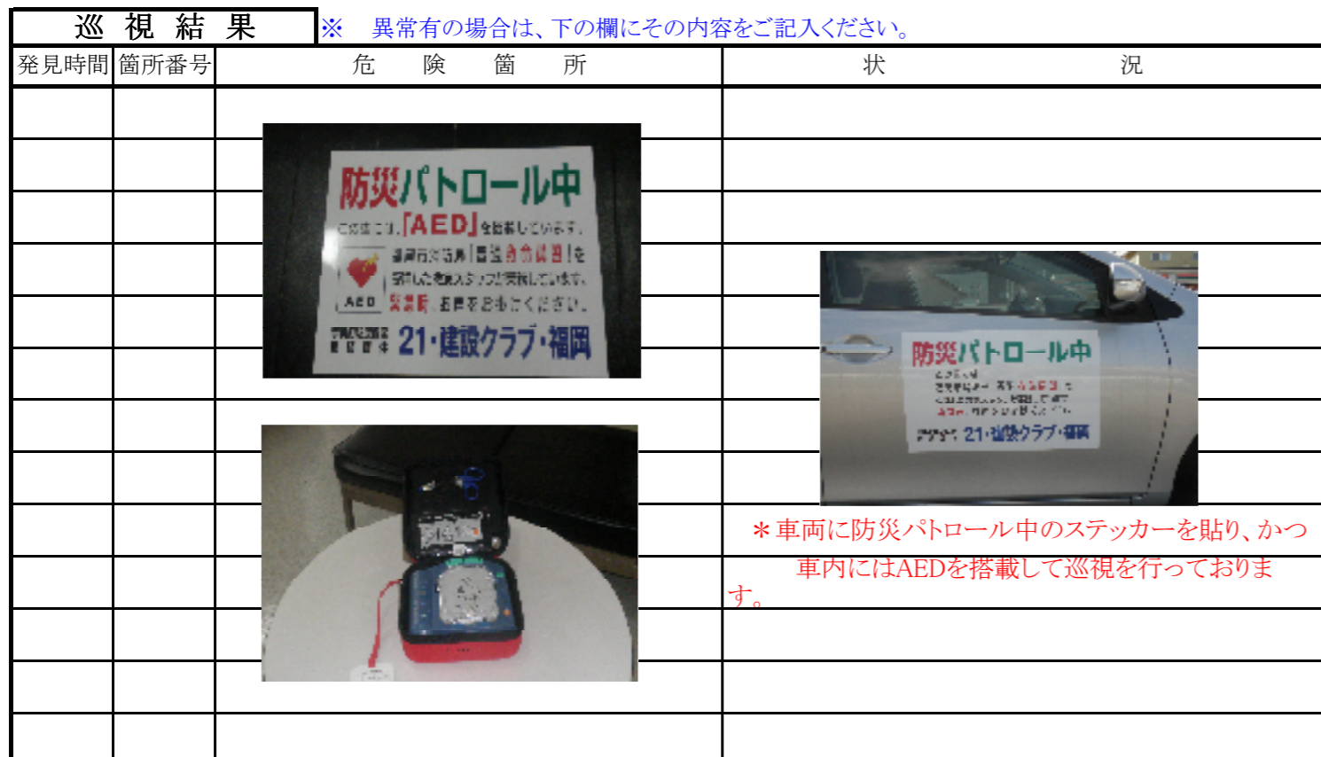
巡視写真(箇所番号①～⑥)