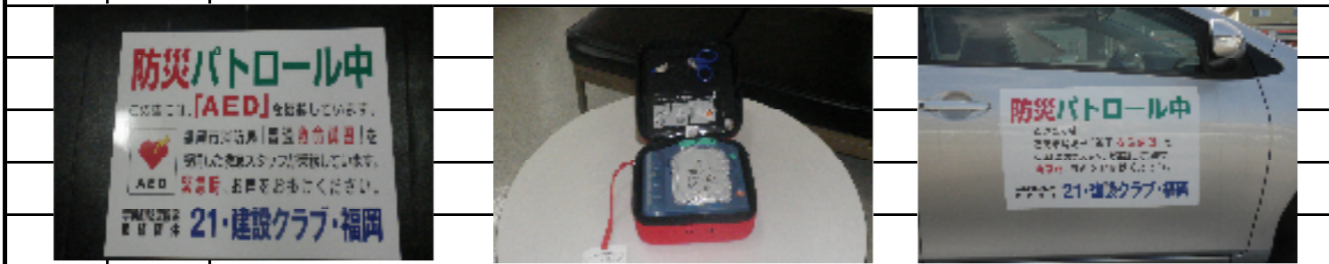
巡視写真(箇所番号①~⑥)

* 車両に防災パトロール中のステッカーを貼り、かつ 車内にはAEDを搭載して巡視を行っております。