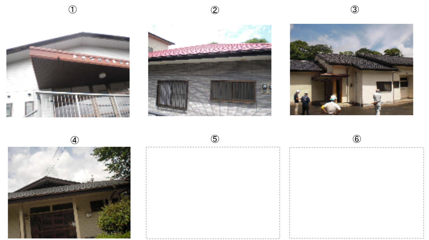
巡視写真(箇所番号①~⑥)

* 車両に防災パトロール中のステッカーを貼り、かつ 車内にはAEDを搭載して巡視を行っております。