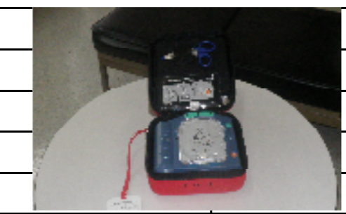
巡視写真(箇所番号①～⑥)