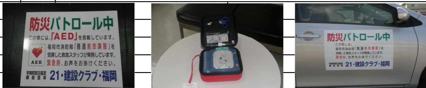
巡視写真(箇所番号①～⑥)

* 車両に防災パトロール中のステッカーを貼り、車内にはAEDを搭載して巡視を行っております。