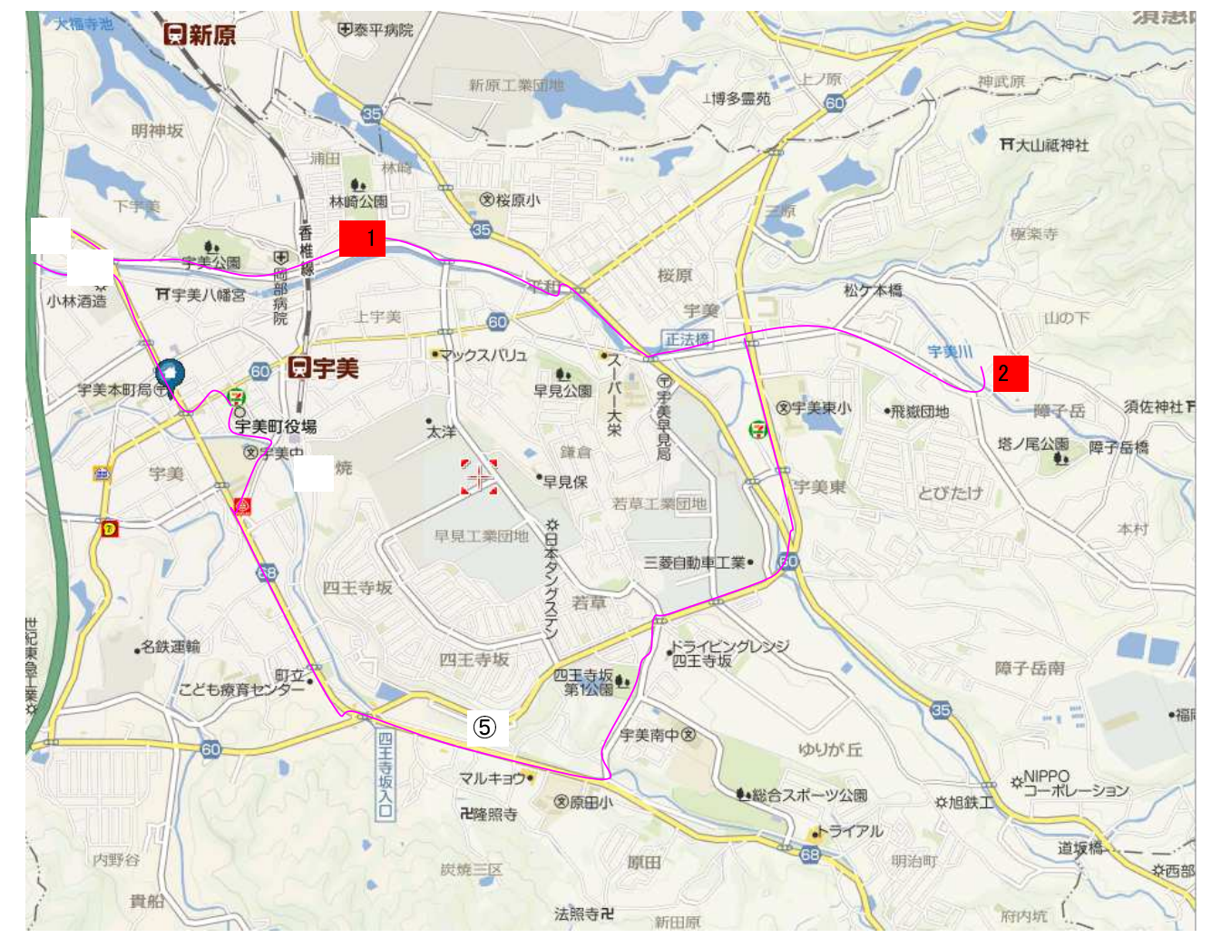
巡視写真(箇所番号①~⑥)